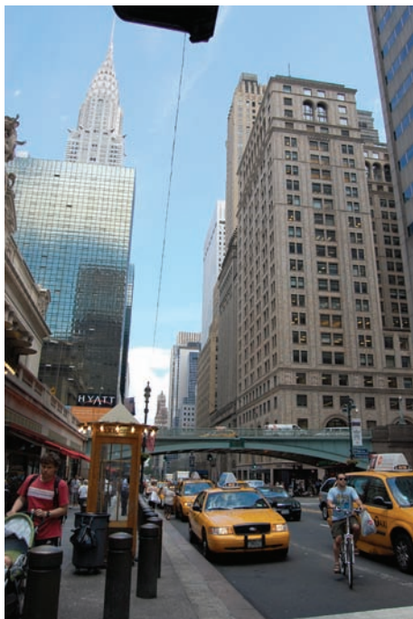
Lexington Avenue je jedna z nejdelsích jednosměrek na světě, měří celkem 9 kilometrů. Běží od 131. Východní ulice k Gramercy Parku na 21. ulici a postupně prochází newyorskými čtvrtěmi Harlem, Carnegie Hill, Midtown, Murray Hill a zejména Upper East Side of Manhattan, kde se odehrává jedna z epizod našeho bridžového příběhu. Její základy položil americký developer Samuel Ruggles v roce 1832. S ní rovnoběžná směrem na východ je Třetí Avenue.

„Tak ty mi řekneš, abych si vzal tričko, a sama se vyšvihneš za princeznu?“ protestoval jsem.