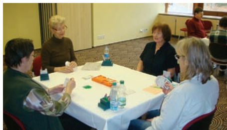
Ostré boje v turnajích

Jih musí jen se 6 body dražit 1 BT a ne 2♠, které by ukazovaly sílu od 9 bodů. Sever pak rovnou skočí na 3 BT. Západ vynese ♥Q, kterou by měl hlavní hráč vzít, protože soupeři by po