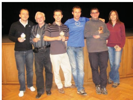
Trojice medailistů VC Českých Budějovic

Týmový turnaj se hrál netradičním hodnocením Board-A-Match nejprve ve dvou skupinách po šesti týmech každý s následným rozřazením do dvou skupin A a B, kde se dohrával pouze zbytek zápasů. Vítězem se stal tým ve složení Macura-Kopecký-Scháňka-O. Bahník. Bývalí juniorští reprezentanti (a juniorskí mistři světa) tak dosáhli v Budějovicích na cenný „double“.