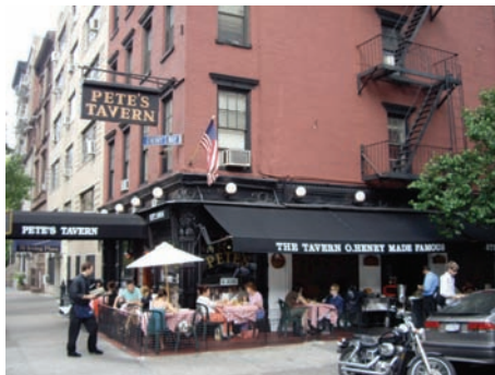
Přímým pokračováním Lexington Avenue do centra je pak Irving Place, místo mnoha restaurací, bister a hospůdek. Náměstí je pojmenováno po spisovateli Washingtonu Irvingovi, který zde žil. Restaurace Pete's Tavern, která je v provozu už od roku 1864, je údajně nejstarší podnik svého druhu v New York City. Proslavil ji jiný spisovatel, O. Henry, který tu napsal některá svá díla.