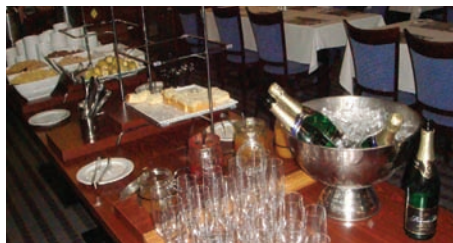
Snídaně se šampaňským

V sobotu odpoledne jsme si ještě zopakovali jednu přednášku ze zdokonalovacích kurzů, které pobíhají v klubu BKP vždy v pondělí od 1000. Podrobnosti o kurzech pro začátečníky i zdokonalovacích lekcích najdete na mých stránkách http://eva.fort.cz . A zde je ukázka z jedno-