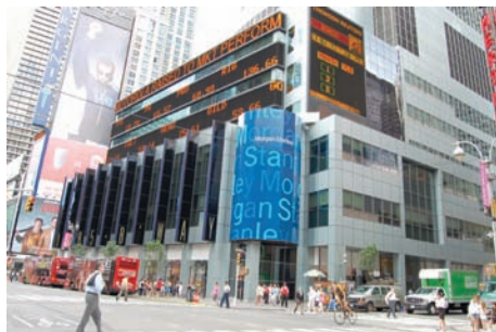
Broadway, ústřední tepna New Yorku

Vznikla čtyřkartová koncovka, v níž Číňanovi zbývají už jen piky, zatímco major drží KQJ v srdcích a vysokého kluka trefového: