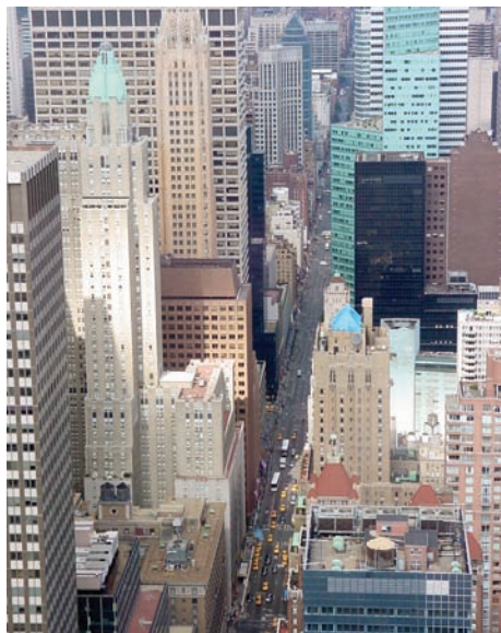
Lexington Avenue z vrcholu Chrysler Building

Oba se na karty vrhli jako párek vlků. Mně se začátek trochu zadrhl. V několika partiích za sebou jsem dostal strastiplných šest, osm bodů