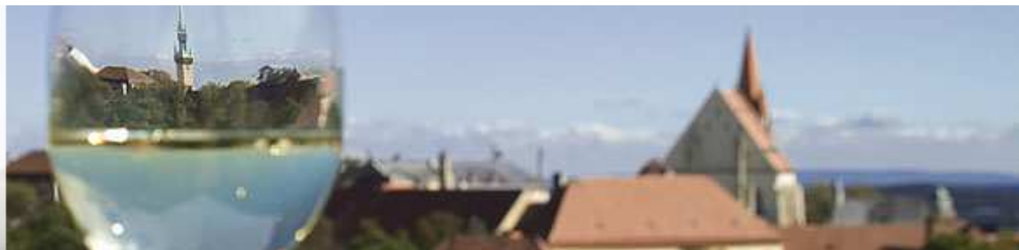
Znovín, A.G. - Weinproduzent