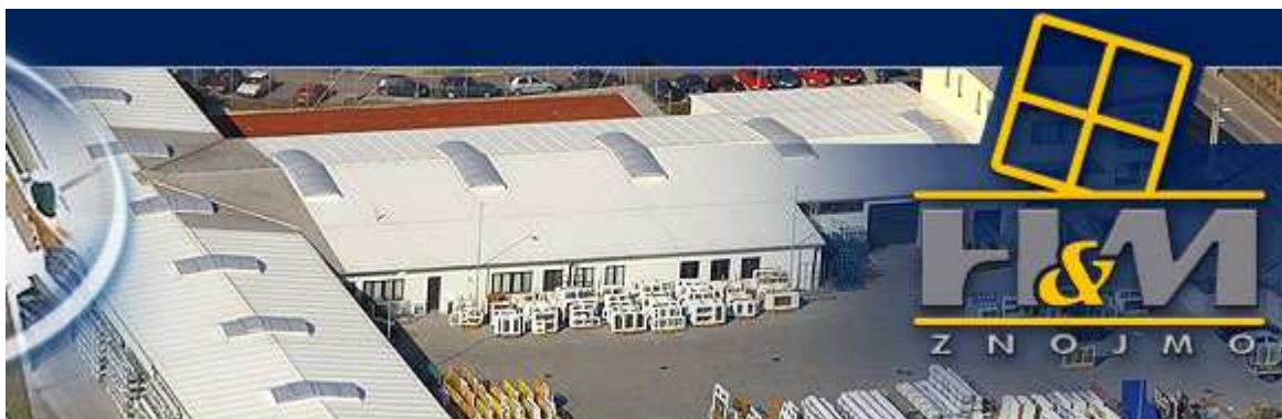
H&M, GmbH – ein Hersteller von Kunststoffenstern